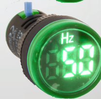
RH10122RHZGR FRECUENCIMETRO VERDE 0-99HZ