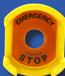
RHEVA8ES68 Protector para pulsador interruptor tipo "seta" Protege del accionamiento accidental