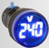
RH10122RAVBL VOLTIMETRO AZUL 20-500V PARA CORRIENTE ALTERNA (AC)

Piloto Led digital, voltímetro, amperímetro o frecuencímetro y además con diferentes colores. Posibilidad corriente alterna (AC) de 20-500V AC ó corriente continua (DC) de 5-60V DC Los pilotos utilizan un tubo de pantalla digital LED, larga vida útil. Pilotos luminosos digitales de diámetro del orificio 22mm. Disponible en diferentes colores (verde, rojo, y azul).