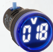
RH10122RDVBL VOLTIMETRO AZUL 5-60V PARA CORRIENTE CONTINUA (DC)