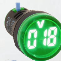
RH10122RDVGR VOLTIMETRO VERDE 5-60V PARA CORRIENTE CONTINUA (DC)