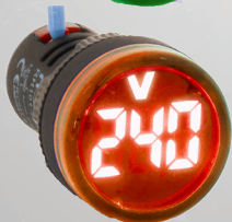
RH10122RAVRE VOLTIMETRO ROJO 20-500V PARA CORRIENTE ALTERNA (AC)