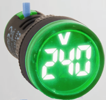
RH10122RAVGR VOLTIMETRO VERDE 20-500V PARA CORRIENTE ALTERNA (AC)